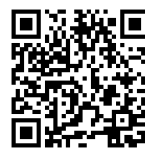
プッシュ型通知サービスについて