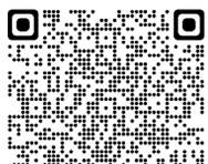
噴火速報について