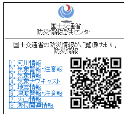
防災情報提供センター 携帯端末向けホームページ (Top)